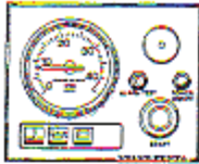
Tableau de bord, alternative «A»