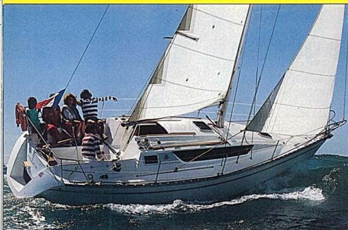
Abondamment toilé, le Sun-Light apprécie la brise. Un cockpit bien dessiné et décoré de teck.

par Pierre-Jean Soler plans Robbert Das et Claude Kirner