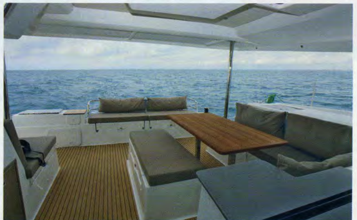
Accueillant. Une grande table entourée de longues banquettes, une méridienne et un canapé : le cockpit peut accueillir beaucoup de monde. La plancha et la plate-forme arrière sont toutes deux en option.

ne se sentiront pas isolés : le siège de barre est une banquette qui peut accueillir une ou deux autres personnes, et d'où l'on profite à la fois de la vue et de l'abri relatif du rouf. On est d'autant plus tenté de s'y installer que le reste de l'équipage peut se prélasser juste à côté, sur le vaste «lounge deck», tout en restant en contact visuel et auditif avec le barreur. Et pour celles ou ceux qui préfèrent faire la sieste, il y a encore le grand bain de soleil à l'avant.