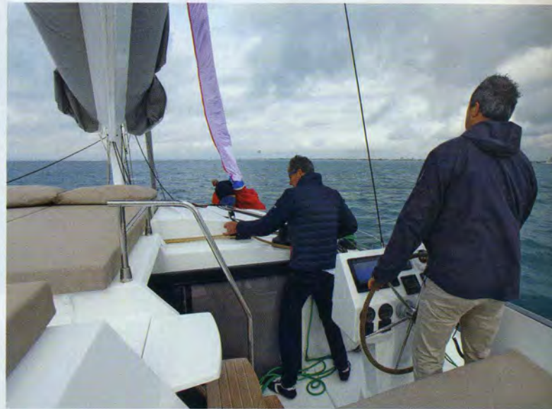
En duo. Le barreur, en hauteur, n'est pas gêné par l'équipier au piano. Celui-ci peut se caler contre l'hiloire et manœuvrer dans une bonne position.