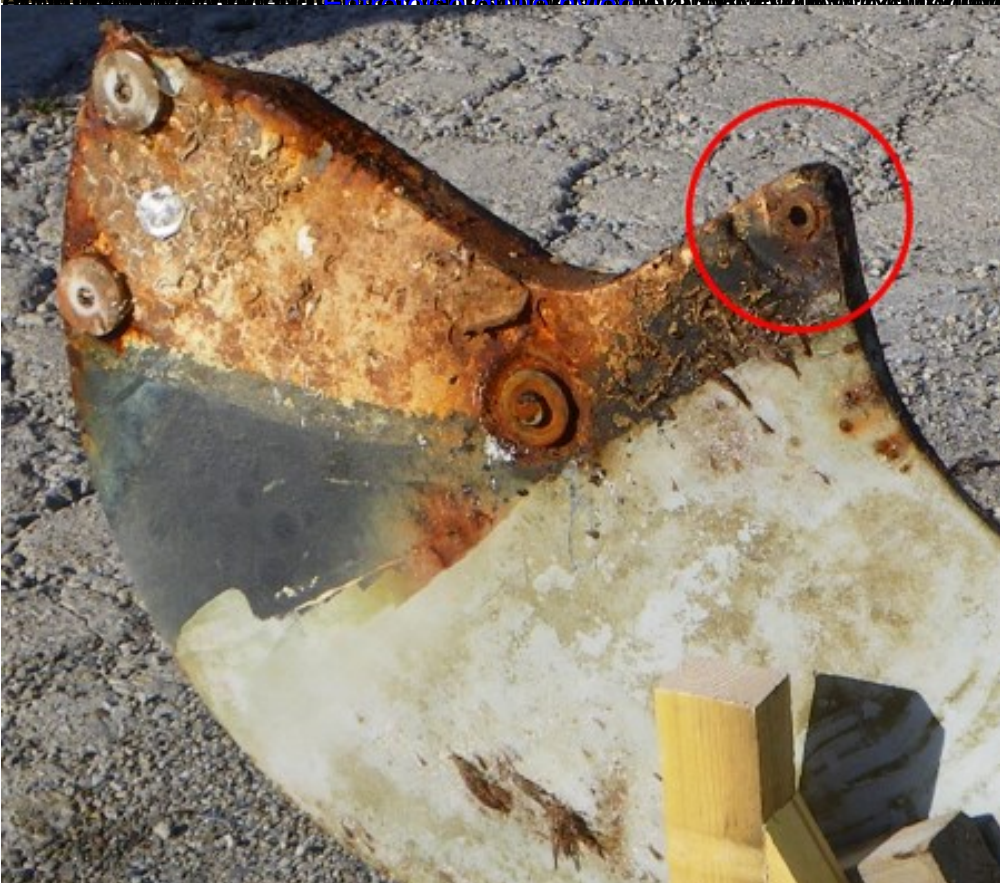
La quille en fonte First 21 est en mauvais état et doit être remplacée.