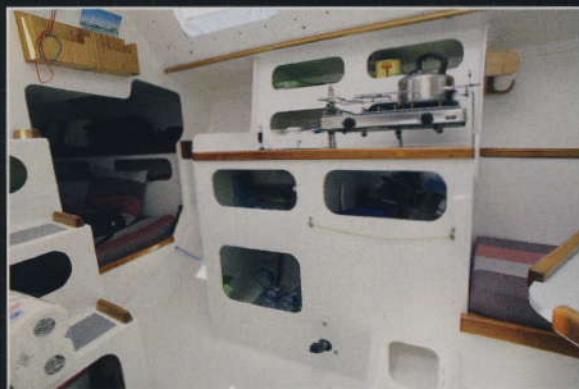
▲ Un réchaud deux feux remplace le modèle un feu standard, mais sa position surélevée n'est pas très rassurante.