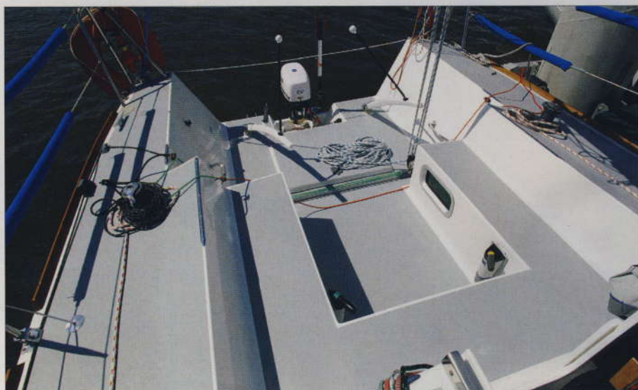
▲ Mention très bien pour ce cockpit en deux parties. La longueur totale est de 2,70 m, dont 1,40 m pour les banquettes. A noter aussi la largeur plutôt généreuse des passavants : 45 cm.