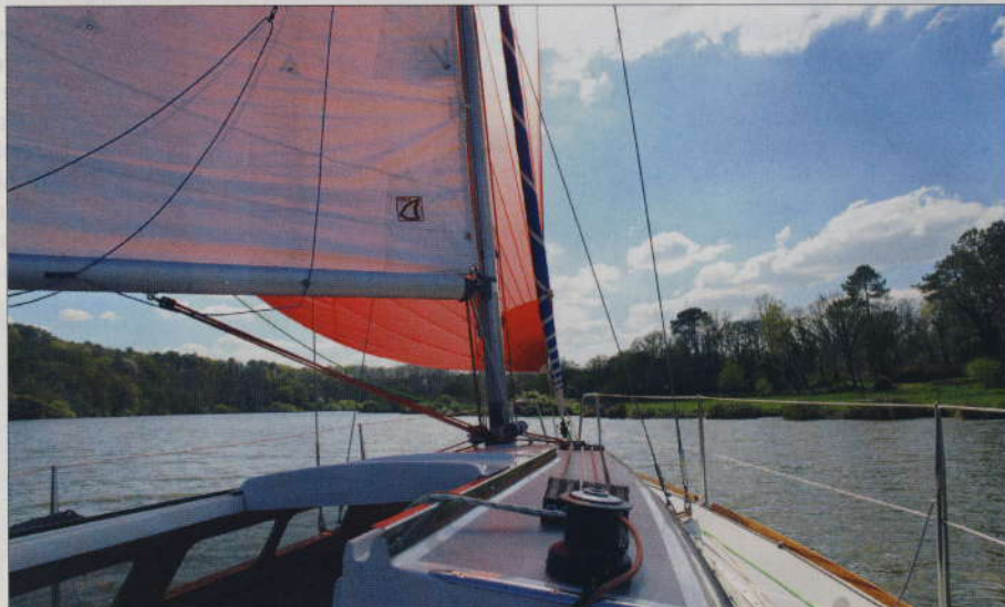
▲ Sur LoFilo , un spi asymétrique de dimensions très raisonnables. Un peu petit, même... Devant les winches de piano, des bloqueurs Antal ont remplacé avantageusement la fourniture d'origine.