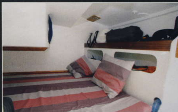
▲ Une belle couchette arrière, de longueur plus que suffisante, installée dans le sens perpendiculaire à la marche.