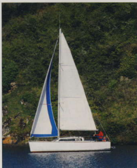
▲ Avec ses cadènes rentrées, le Filo peut porter un vrai génois. Un gros atout dans le petit temps.