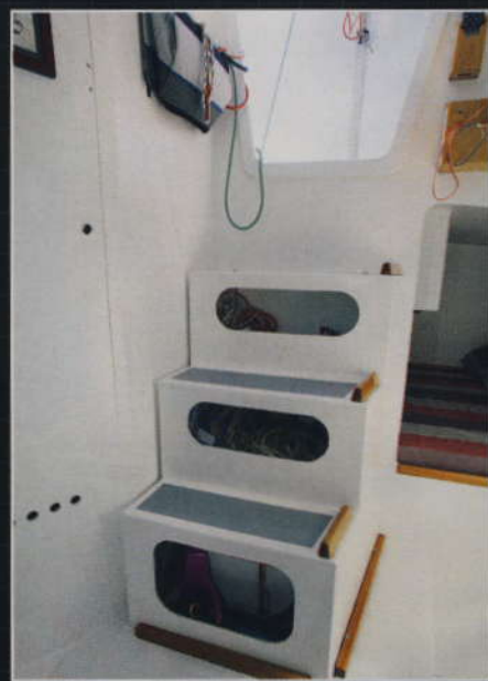
▲ Chaque marche de descente abrite un équipement de grande contenance. Pratique !