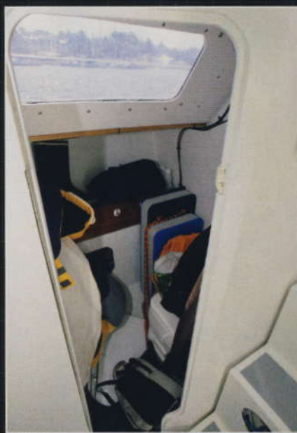
▲ Vraiment exigü, le cabinet de toilette servira plutôt de penderie à cirés et de débarras.