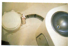
Un peu exigu, le cabinet de toilette manque en particulier de hauteur, mais l'espace autour du wc est amplement suffisant.