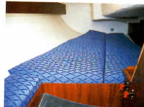
Il n'y a rien de trop comme hauteur sous le cockpit, mais la surface de la couchette double s'avère généreuse.