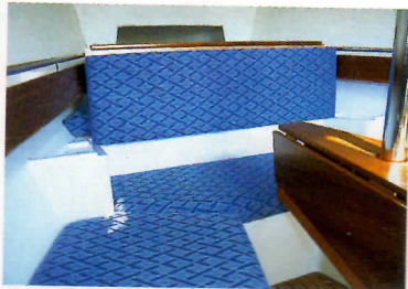
La couchette avant se transforme rapidement en un confortable dossier. Dans la version définitive, la cloison du puits à chaîne sera habillée de bois et les rebords d'équipets rehaussés.

com- de sé- aviga- cartes et du illage b-bat- e que le hu- arrière- sition s op- T au t que auto- bien e de mp- ment le!