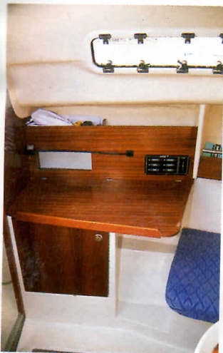
La table à cartes est de bonne dimension, mais pas idéalement orientée par rapport à la position de la tête de banquette qui fait office de siège de navigateur. Notez le long hublot ouvrant placé au-dessus.