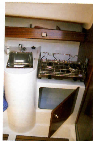
D'autres modifications sont prévues pour la suite de la série: un évier rond remplacera le rectangulaire de notre bateau d'essai et les équipets seront plus grands.