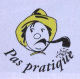
Tout objet tombé sur le plancher risque de finir dans les fonds, sous le meuble de la cuisine.