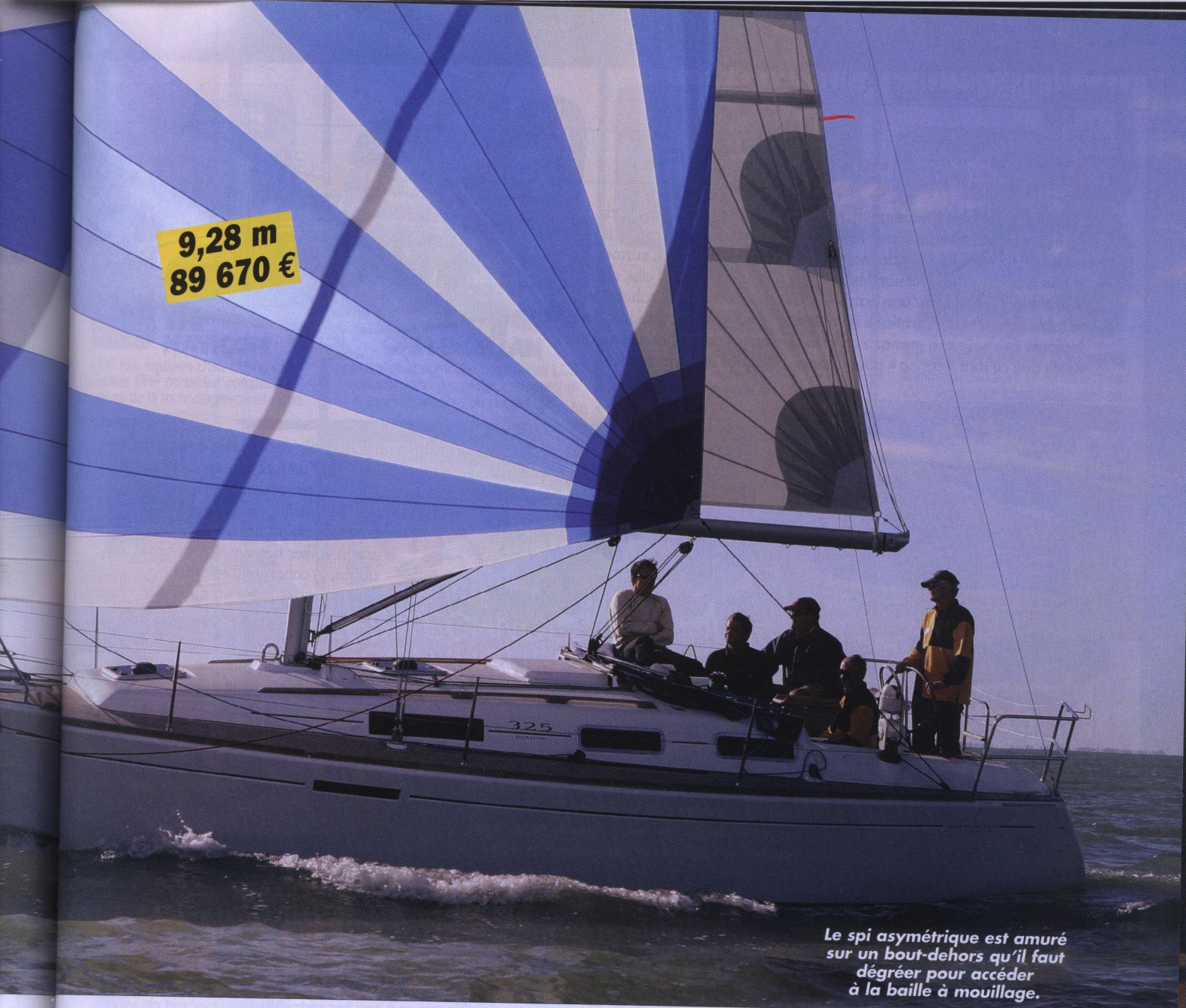
Le spi asymétrique est amuré sur un bout-dehors qu'il faut dégréer pour accéder à la baille à mouillage.