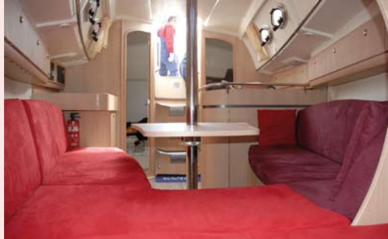
> Un design nouveau signé Bertone avec une table pivotante, une cuisine bien pensée et des mains courantes inox partout.

La table à cartes est à tribord. Elle n'est pas dans la marche du bateau et s'utilise en position debout. En face, une belle cuisine en « L » d'un style classique comportant tous les rangements nécessaires. Notez encore le volume très généreux de la salle d'eau où l'on dispose d'une belle penderie pour les cirés.