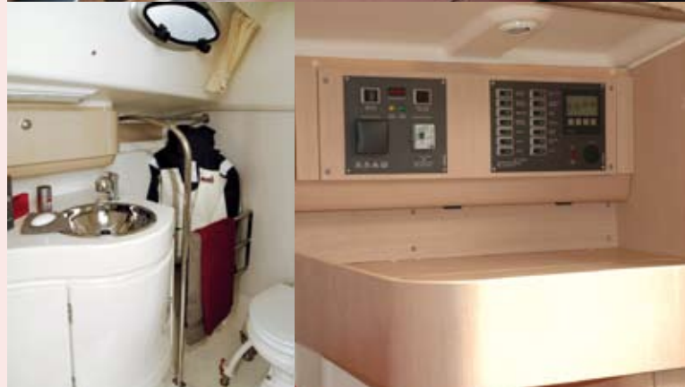
> Salle d'eau confortable et table à cartes « debout ».