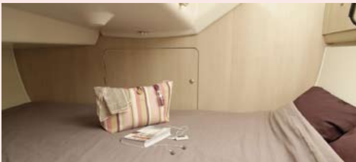
> Une couchette double, perpendiculaire au sens de la marche.