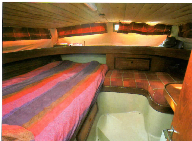
La très belle cabine arrière, équipée d'un petit bureau, est ceinturée de hublots fixes sur les côtés et sur l'arrière.