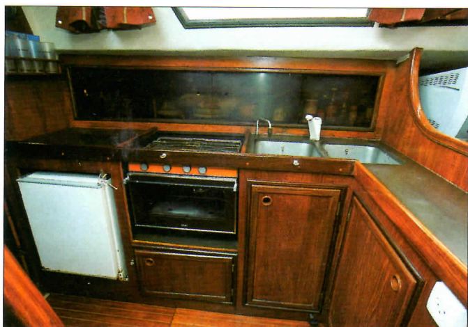
Le plan de travail sur le côté de la cuisine en L est généreux, tout comme le long équipet supérieur.

Longueur coque : 11,33 m. Longueur à la flottaison : 9,54 m. Largeur : 3,65 m. Tirant d'eau : 1,80 m. Lest : 3 040 kg. Déplacement : 8 000 kg. SV : 83,70 m 2 . Génois lourd : 39 m 2 . GV : 25,90 m 2 . Artimon : 8,80 m 2 . Matériau : stratifié verre/polyester. Architecte : André Bénétteau. Moteur : diesel Ford 60 ch. Gasoil : 250 l. Eau : 500 l. Année de lancement : 1979. Arrêt de la construction : 1983. Nombre d'unités produites : 103. Constructeur : Bénétteau.