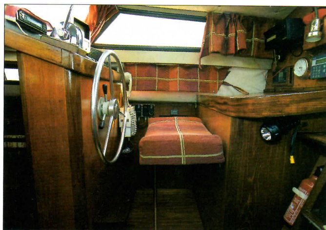
Sur l'arrière de la timonerie intérieure, la table à cartes. On y travaille debout, siège baissé, tourné vers l'arrière.