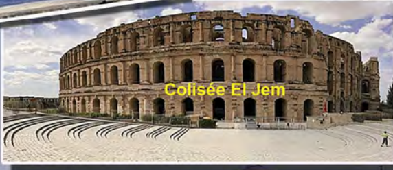
Colisée El Jem