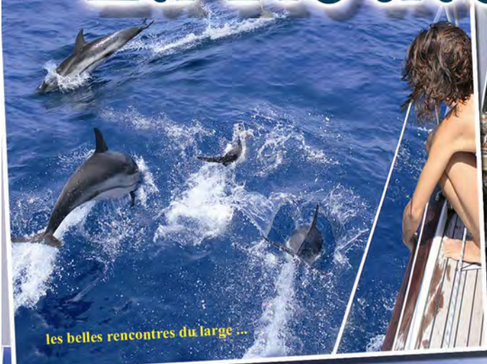
les belles rencontres du large ...