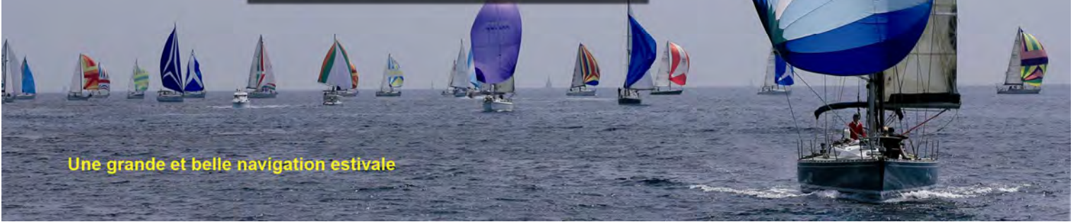
Une grande et belle navigation estivale